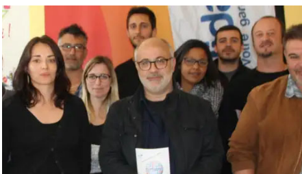
Matinée de la mobilité : une première réussie